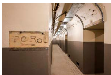
Le poste de commandement souterrain du Colonel Rol-Tanguy