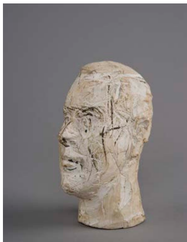
Alberto Giacometti, Tête du colonel Rol-Tanguy , 1946. Plâtre peint