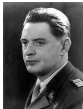
Le colonel Rol-Tanguy (1908-2002)

Alberto Giacometti est fortement inspiré par la tête de ce « monument » qu'est devenu le colonel Rol-Tanguy. Les recherches de l'artiste sur la représentation humaine et notamment les têtes datent d'avant la guerre (1935 - 1940) et se poursuivent à son retour en France. Retravaillant encore et toujours la figure humaine, Giacometti s'empare ainsi de la commande du portrait de Rol-Tanguy pour la transformer en un véritable terrain d'expérimentation et d'essai. Son travail sur les proportions et sur le socle lui permet de magnifier ses petites sculptures et de leur donner une nouvelle dimension. Les portraits sculptés de Rol-Tanguy sont aussi l'occasion pour Giacometti de poser la question de l'universalité, en s'éloignant d'une représentation réaliste pour se diriger vers une simplification des formes.