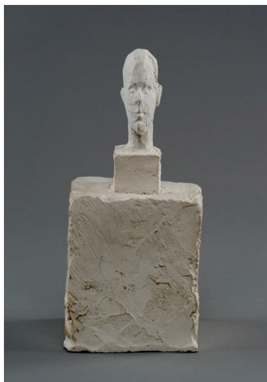
Alberto Giacometti, Tête d'homme sur double socle (étude pour la Tête du colonel Rol-Tanguy), 1946. Plâtre, 19,6 x 9,1 x 8,6 cm

L'exposition sera présentée du 1 er octobre 2021 au 30 janvier 2022 au musée de la Libération de Paris-musée du général Leclerc-musée Jean Moulin, juste au-dessus des lieux qui abritèrent le poste de commandement régional FFI à la Libération de Paris, d'où furent envoyés les ordres du « colonel Rol ».