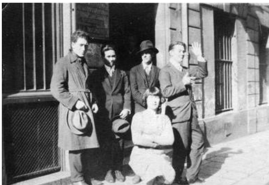
Alberto Giacometti et quelques camarades devant l'entrée de la Grande Chaumière, Paris, c. 1925

L'Institut Giacometti, Paris propose un programme de recherche sur l'histoire de l'art moderne : l' École des Modernités . Ce programme a pour ambition de soutenir les projets originaux dans l'étude de l'art de la période moderne (1905-1960).