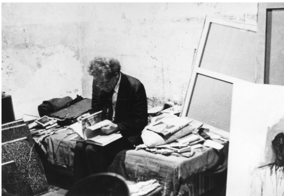
Alberto Giacometti dans son atelier, 1961, Photo : Isaku Yanaihara, Archives de la Fondation Giacometti

L'Institut Giacometti, Paris propose un programme de recherche sur l'histoire de l'art moderne : l' École des Modernités . Ce programme a pour ambition de soutenir les projets originaux dans l'étude de l'art de la période moderne (1905-1960).