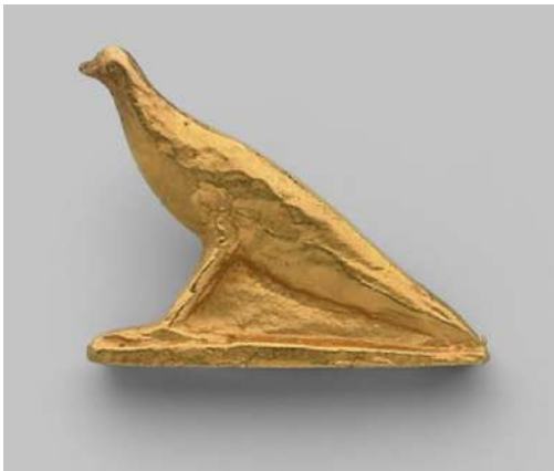
Alberto Giacometti, Broche, modèle oiseau , vers 1935-1939.

Pour d'autres activités et découvertes, retrouvez la Fondation Giacometti sur les réseaux sociaux et sur www.fondation-giacometti.fr